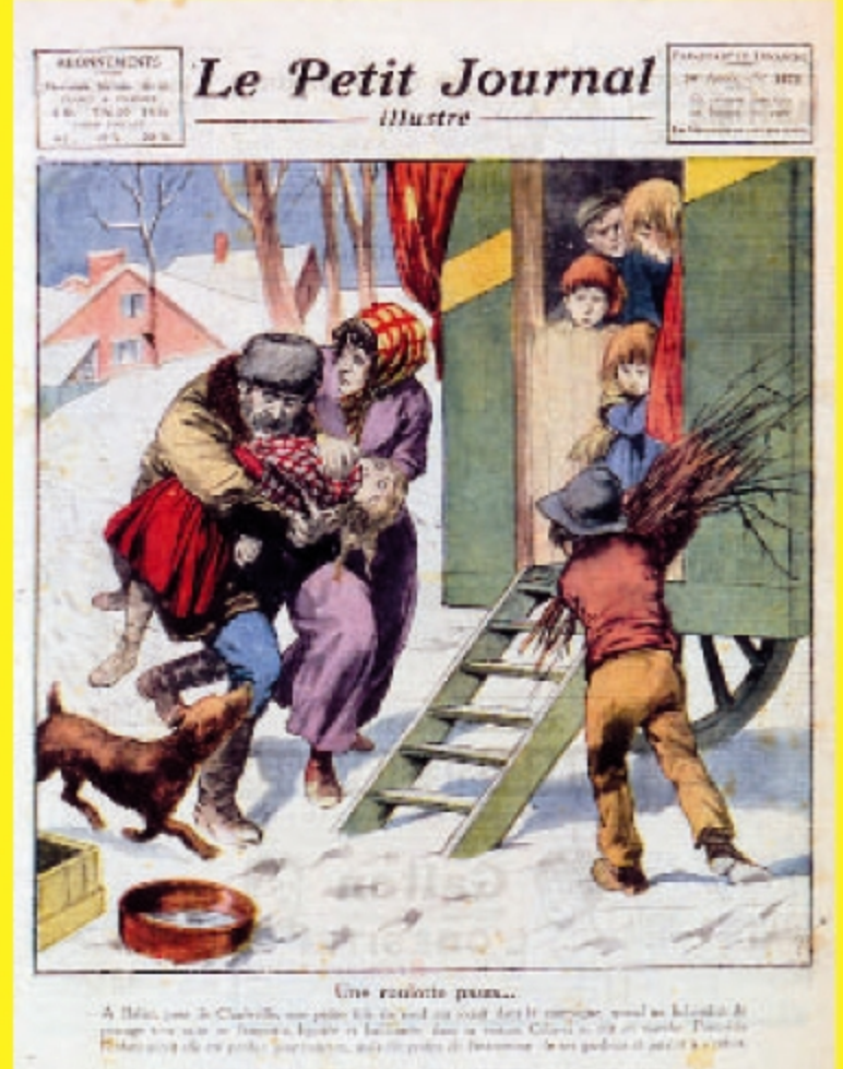
De nombreuses accusations mensongères et diffamantes circulent longtemps sur le compte des Tsiganes. On les présentait notamment comme des voleurs d'enfants comme le montre la une de ce journal à gros tirage. Le Petit Journal, 1923.