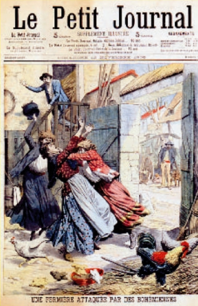
La presse de l'époque véhicule l'image intolérable de Tsiganes fourbes, malhonnêtes, voleurs et dangereux. Le Petit Journal, 1905. BNF Reproduction.

Bien que tous les Tsiganes ne voyagent pas, la mobilité de certains d'entre eux est suspecte pour la police, qui les surveille de près. L'Etat va tout faire pour les sédentariser.