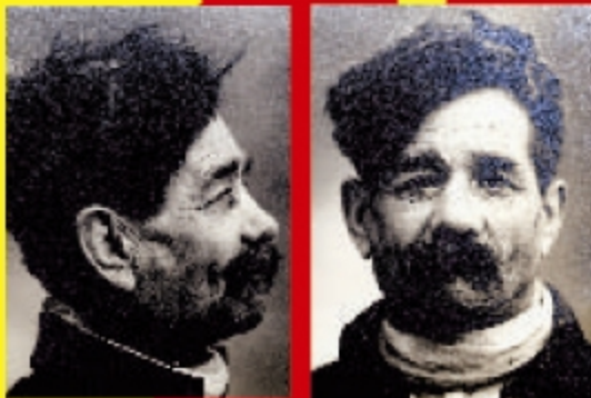
Cliché d'un carnet anthropométrique. L'homme est désigné par le nom de la commune où il est prisonnier. Le carnet est supprimé qu'en 1969. Archives de la Gendarmerie Nationale.

Le carnet anthropométrique restera en vigueur jusqu'en 1969 et permettra au régime de Vichy aux ordres des nazis en 1940 de les identifier, de les arrêter et de les regrouper dans des camps d'internement en France.