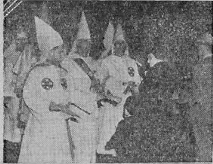
Quel nouveau lynchage préparent-ils ?

Stetson KENNEDY prépare actuellement la publication de son nouveau livre : « Guide de l'Amérique raciste », qui doit faire sensation aux Etats-Unis et en Europe.