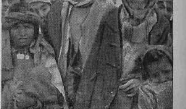
Le visage décoloré et fier de la Tunisie