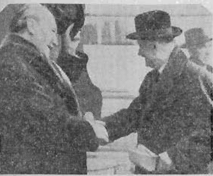
ADENAUER : « Je suis très satisfait, n'avez pas l'air si gêné... »

PENDANT une semaine, sous le regard attentif de la France et du monde entier, s'est déroulé un débat de haut niveau sur le réarmement ou non des généraux SS, des criminels nazis déjà bannis.