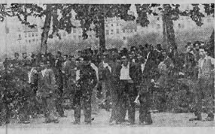
Une des nombreuses manifestations qui se déroulèrent à Lyon en septembre dernier, en faveur des travailleurs algériens jugés pour fait de grève. Grâce à l'action antiraciste des Lyonnais, soutenus par l'ensemble du peuple français, les quatre ont été libérés.

Le docteur Cyna (10 e arr.) évoque la situation des travailleurs nord-africains en France, dont il a eu l'occasion de parler un certain nombre. Ils sont sous-alimentés, mal logés,