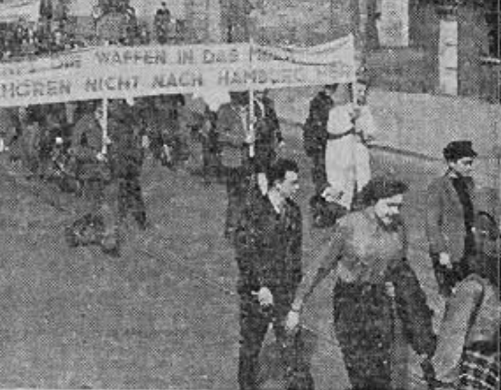
Une manifestation contre le réarmement, comme il s'en déroule de nombreuses en Allemagne occidentale.

LITTÉRATURE. — Hans Grimm, qui dirige la maison d'édition Kiecherow, annonce la publication prochaine de plusieurs livres sur Hitler et la réédition d'un livre sur l'espace vital (« Lebensraum »).