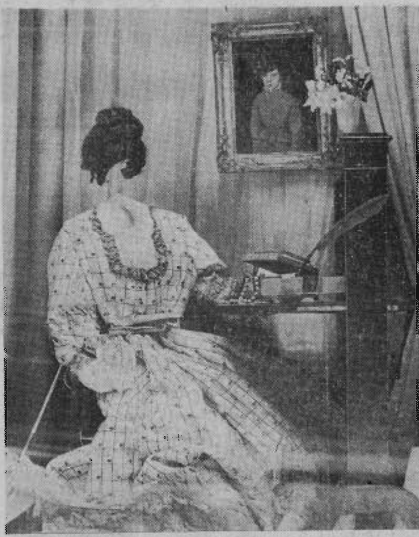
Eugénie Grandet, vue par un étalagiste de la rue Tournon.

Dans le cadre de la quinzaime de St-Germain-des-Prés, un concours de vitrines a lieu, où les commerçants rivalisent d'ingéniosité pour composer leur étalage.