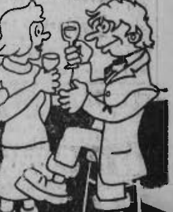
— Ça pourrait aussi s'appeler quinzaine de l'arrose...