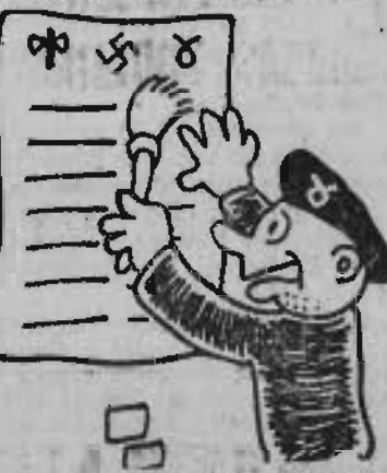
— Il va falloir en envoyer une à Maurras. Il verra que les bonnes habitudes ne se perdent pas.