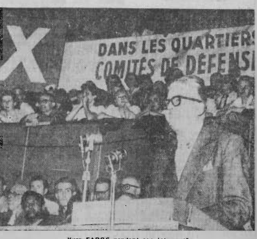
Yves FARGE pendant son intervention

FABRIQUE DE TRICOTS Ets GANA Société à responsabilité limitée au capital de 500.000 francs 64, rue de Tarbois, 64 PARIS (11 e ) TEL. : ARChives 31-48