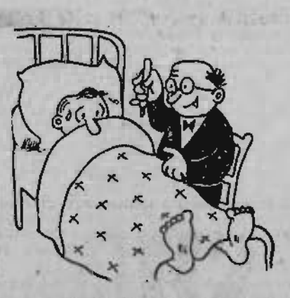
— 28 degrés à l'ombre, fiche endroit pour passer des vacances!