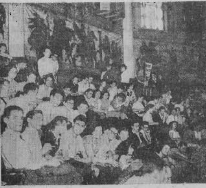
Les Jeunes étaient nombreux