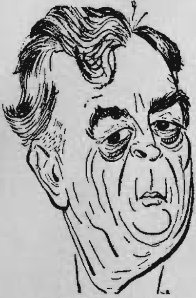
Mundt, l'homme de la 5 e colonne

Karl E. MUNDT est connu comme l'un des agents les plus actifs de la National Association of Manufacturers (Association Nationale du Patronat Américain).