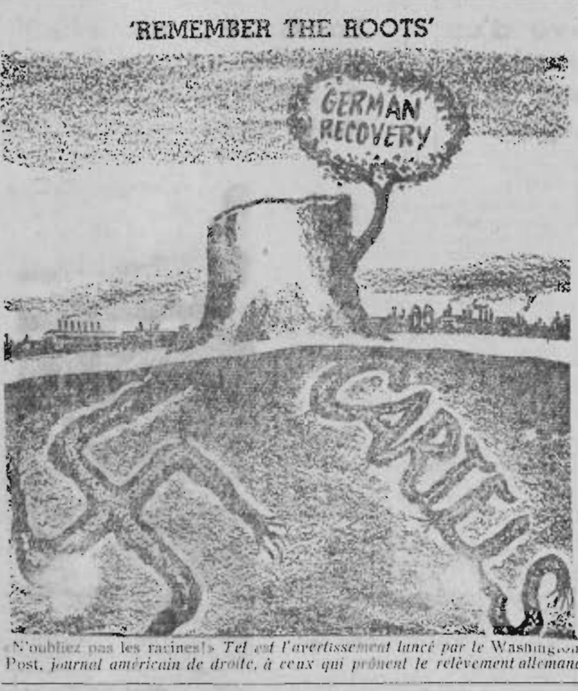
N'oubliez pas les racines! Tel est l'avertissement lancé par le Washington Post, journal américain de droite, à ceux qui prônent le relèvement allemand

(SUITE DE LA PREMIERE PAGE) croissant que les éléments vichystes et collabos tentent de développer au maximum dans notre pays.