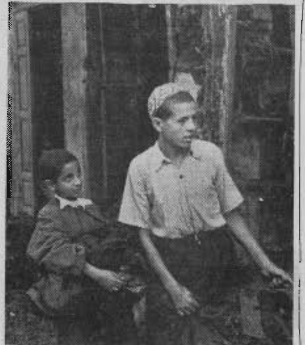
Ils ont échappé au désastre...

La misère, les conséquences de la discrimination raciale pas encore effacées, l'argent des lourds impôts utilisés à d'autres fins que le bien-être des braves gens... C'est à tout cela que nous pensons tandis que le Sultan du Maroc est reçu officiellement à Paris, en grande cérémonie.