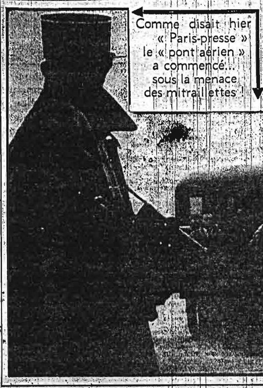
Comme disait hier « Paris-press » le « pont aérien » a commencé... sous la menace des mitraillettes!