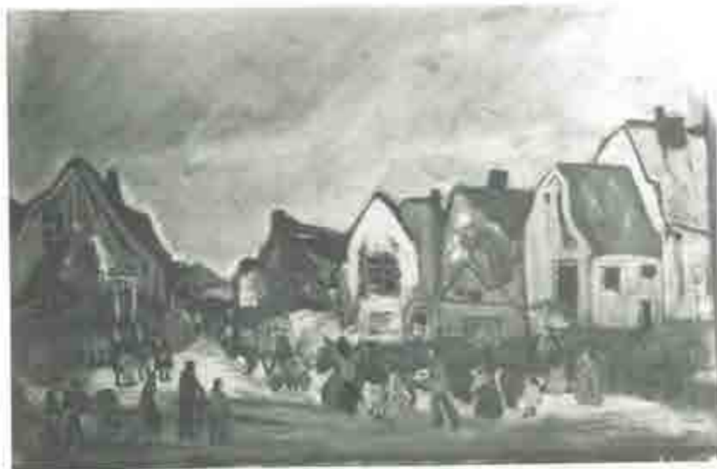
LE PASSAGE DES GITANS Passage des familles Duville et Gaisne aux Rableux, en Eure-et-Loir.

Tableaux de VAN HAMME, le peintre des Gitans.