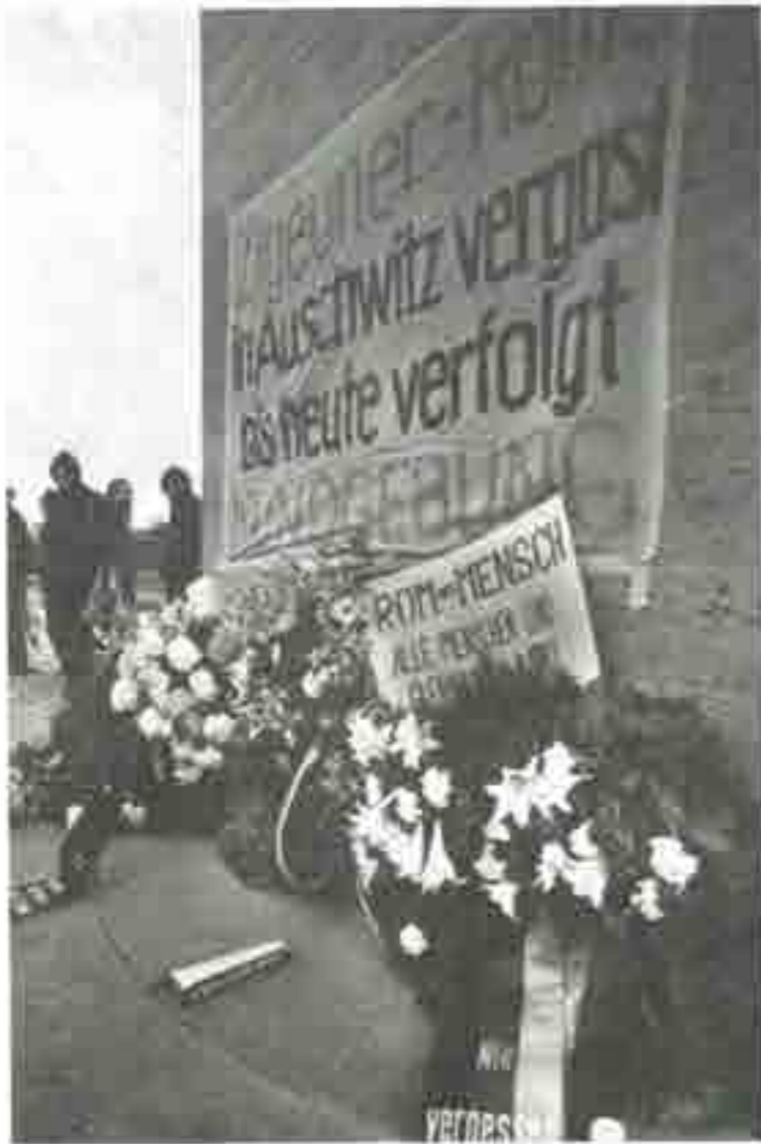
LE MONUMENT DU SOUVENIR AU CAMP DE BERGEN-BELSEN