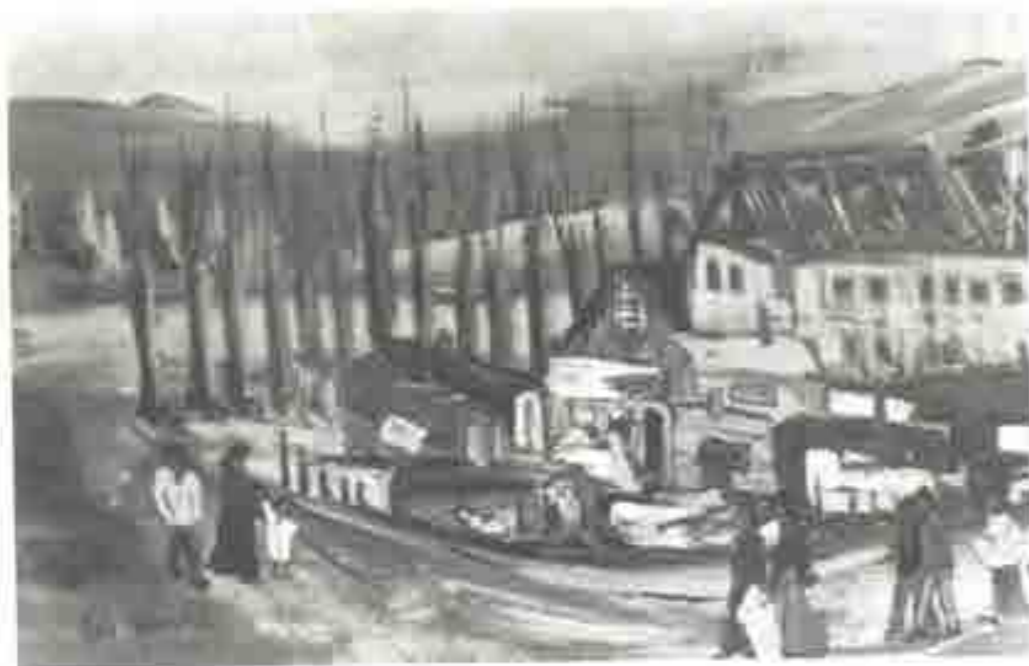
CAMPEMENT DE SANAN PRES DE NOGENT-LE-ROUOU