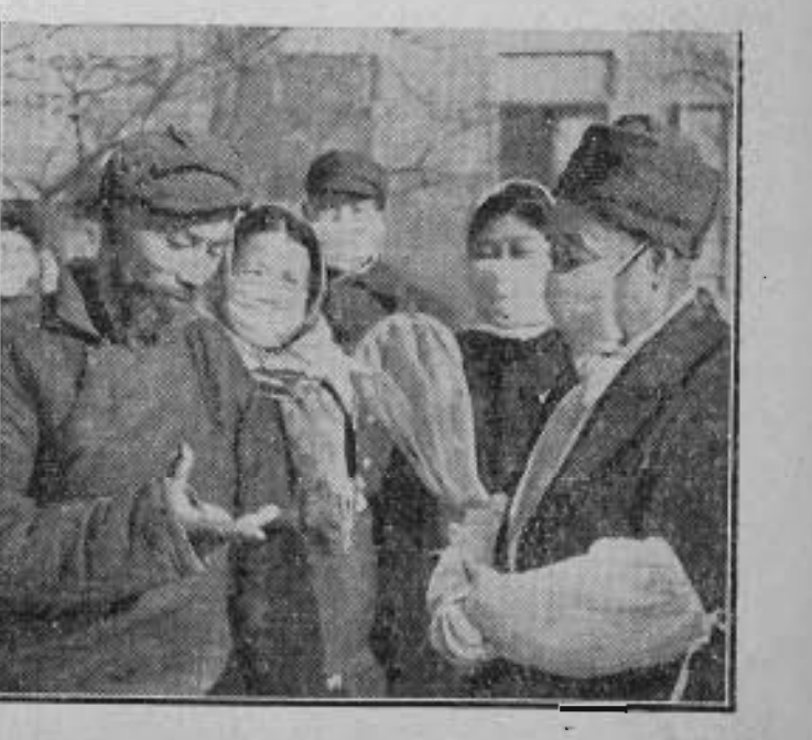
Une équipe de lutte contre les bombes microbiennes.

Déjà le grand public commence à connaître la 4 e Journée Nationale. La belle affiche de Collin, que le grand artiste a bien voulu réaliser pour notre Mouvement, ainsi que l'émouvant dessin de Jean Effel, qui illustre des dizaines de milliers de cartes postales, de mandats et d'invitations, contribuent notablement à en populariser les thèmes.