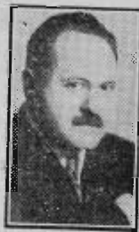
Le Docteur Mosché SNEH, député du Parlement israélien

nous déclare le D r Mosché SNEH Député au Parlement Israélien, Membre du Conseil National de la Paix d'Israël