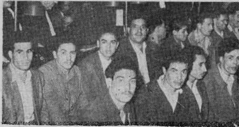
Les Quatorze au tribunal