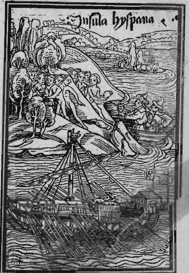
Un instantané du débarquement de Colomb à Haïti (Gravé sur bois de 1494)

nant un poème de Carolus Verardus consacré à la prise de Grenade et la fameuse lettre de Colomb à Sanchez, De Insulis nuper in mari Indico reperiis , représente cette scène de débarquement.