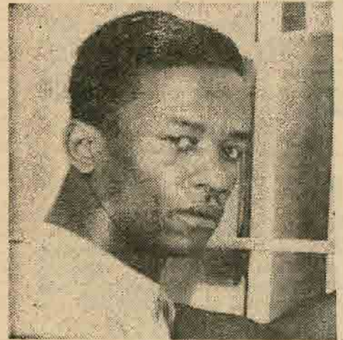
WILLIE McGEE Once again, a deadline

"The conscience of the nation must be aroused and these legal lynchings stopped. . . . All pretenses by the American government to be defending democracy abroad are lies. The murder of the Martinsville Martyrs and the plans to execute an innocent Negro, Willie McGee, and the Trenton Six, are incontestable proof of the American government's official policy of racism, at home and abroad."