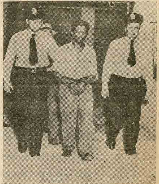
Mac Gee et les brutes policiers

8 MAI 1951 - 6 e ANNIVERSAIRE DE LA VICTOIRE DES