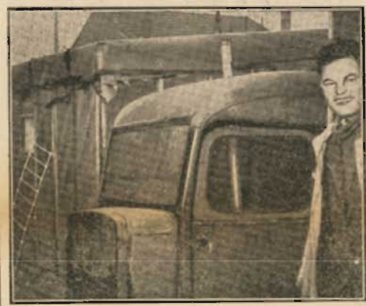
Ils vivent à plusieurs dans un autobus hors d'usage. Cela se passe à Nanterre.

A la cantine Seguin, de la Régie Renault, les travailleurs s'unissent et font cesser les manifestations de mépris raciste. Au chantier de la Résidence Universitaire, à Antony, les 200 travailleurs de l'entreprise Dumézil débrayent pour protester contre les méthodes raciales du chef de chantier à l'égard des Algériens.