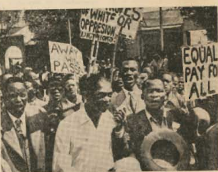
Une manifestation de noirs, à Johannesburg, contre le racisme gouvernemental (Voir nos informations en page 4)