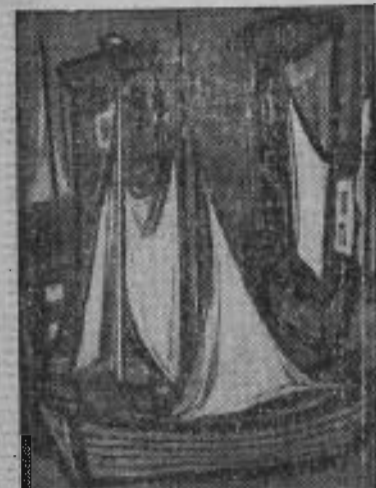
Goldkorn : Un port.