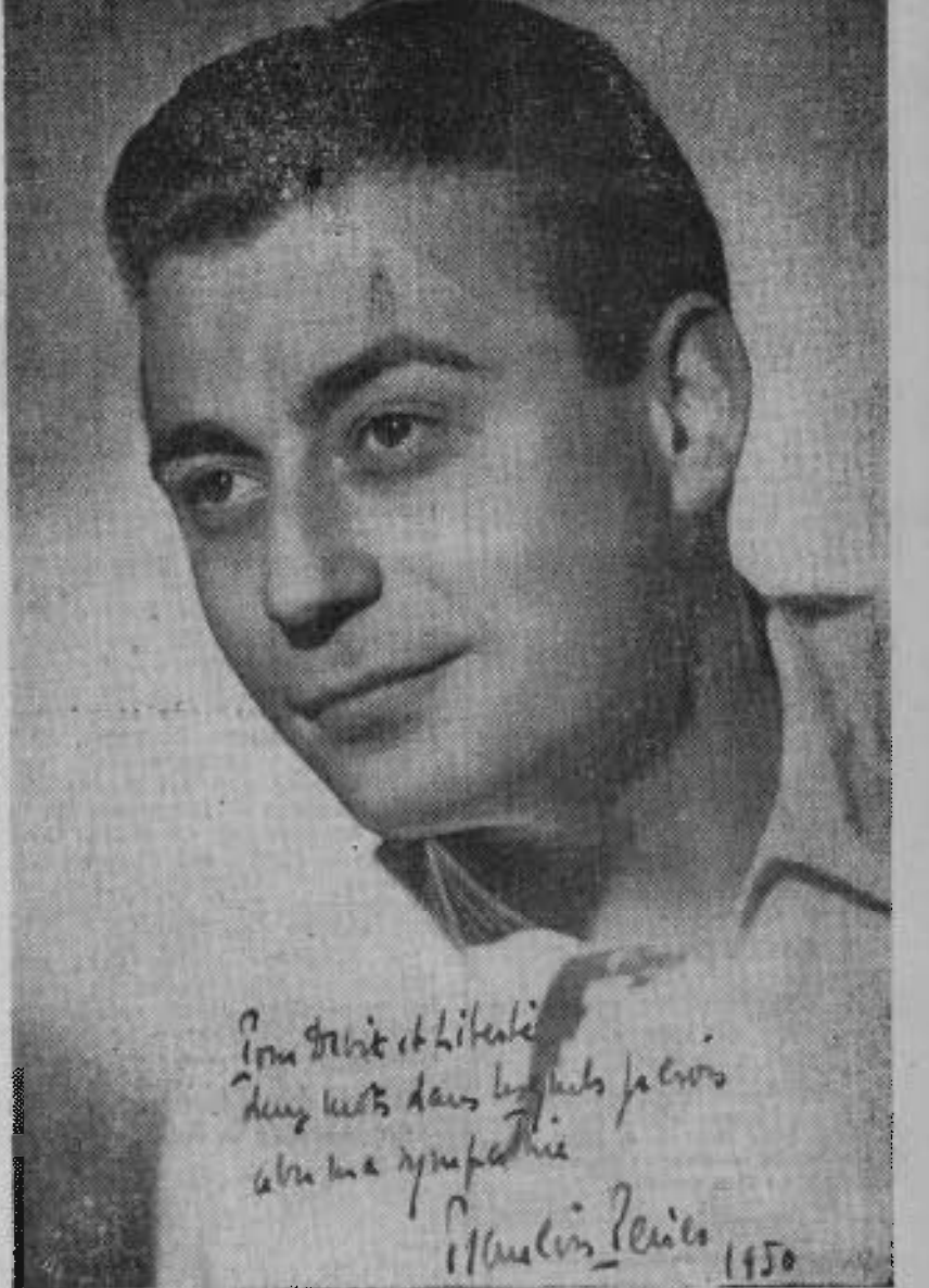
(VOIR NOTRE INTERVIEW PAGE 4)

Dans le quartier Saint-Germain-des-Prés, un antisémite s'est permis, la semaine dernière, d'attaquer les passants juifs en leur criant : « Tous les Juifs doivent être brûlés au crématore. »