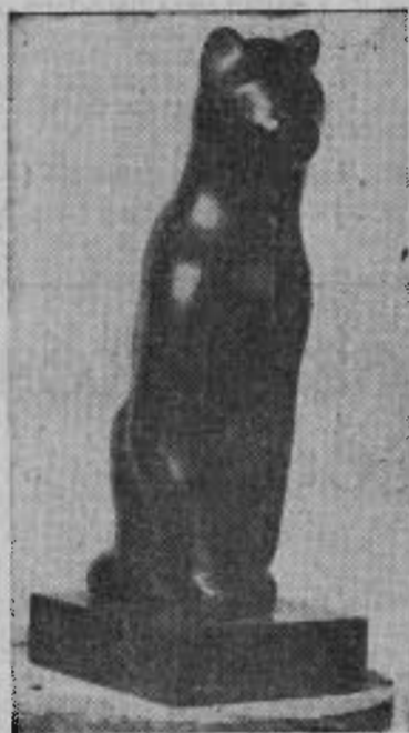
Konstantinowski : Chat.