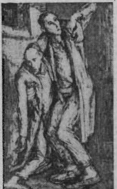
Un dessin de Mendjlaki.