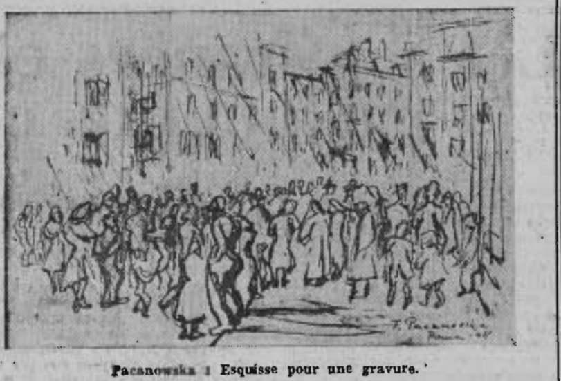
Pacanowska : Esquisse pour une gravure.