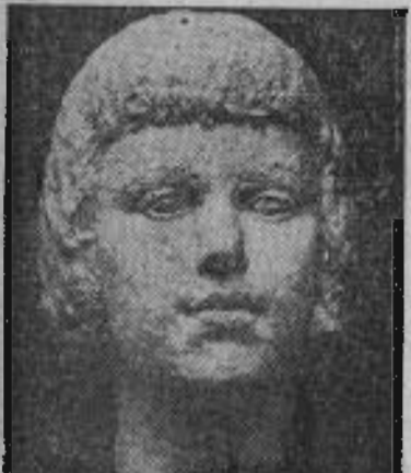
Perelman : Tête de fillette.