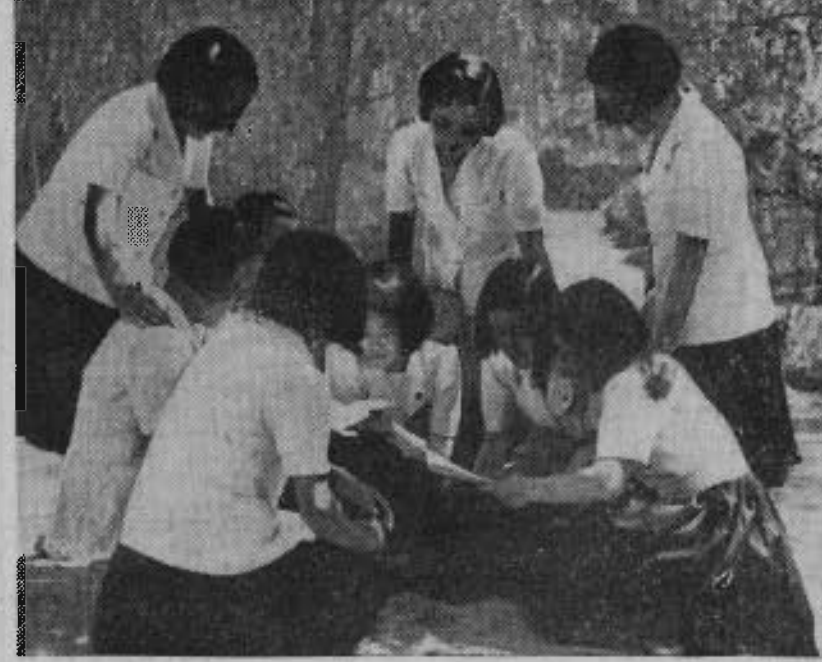
Groupe d'enfants dans une école de Corée du Nord.

LA COREE: depuis quelques jours, cette péninsule asiatique, qui s'étend sur plus de neuf cents kilomètres entre la mer du Japon et la mer Jaune, occupe la vedette sur la scène internationale.