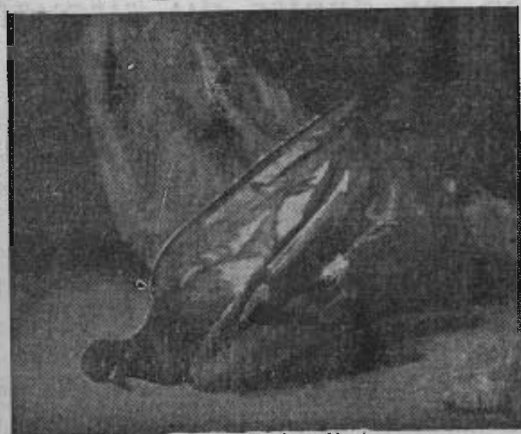
Markiel : Le pigeon blessé.