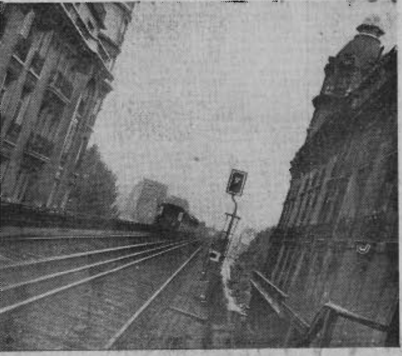
Le métro, c'est Paris, la vie de tous les jours. On s'en sert pour gagner sa croûte. Le métro même aussi les amoureux au rendez-vous. On s'y retrouve devant les premières ou sous l'horloge de la salle des recettes. Le métro, c'est comme l'exprime la si belle chanson d'Yves Montand « A Paris » :

Les tâches immédiates Puis M. Youdine trace les tâches à réaliser dans l'immédiat :