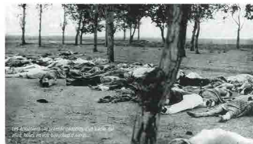
Les Arméniens - le premier génocide d'un siècle qui allait hélas, en voir beaucoup d'autres.

De nombreux pays, dont la France, ainsi que l'ONU, le Parlement Européen et le Tribunal des Peuples ont reconnu officiellement le Génocide arménien. Néanmoins, son impunité a laissé et laisse encore la porte ouverte à d'autres génocides. Le 22 août 1939, avant d'attaquer la Pologne, Hitler n'aurait jamais dû pouvoir inciter ses généraux à la barbarie et se justifier en disant : « Qui de nos jours parle encore de l'extermination des Arméniens ? »