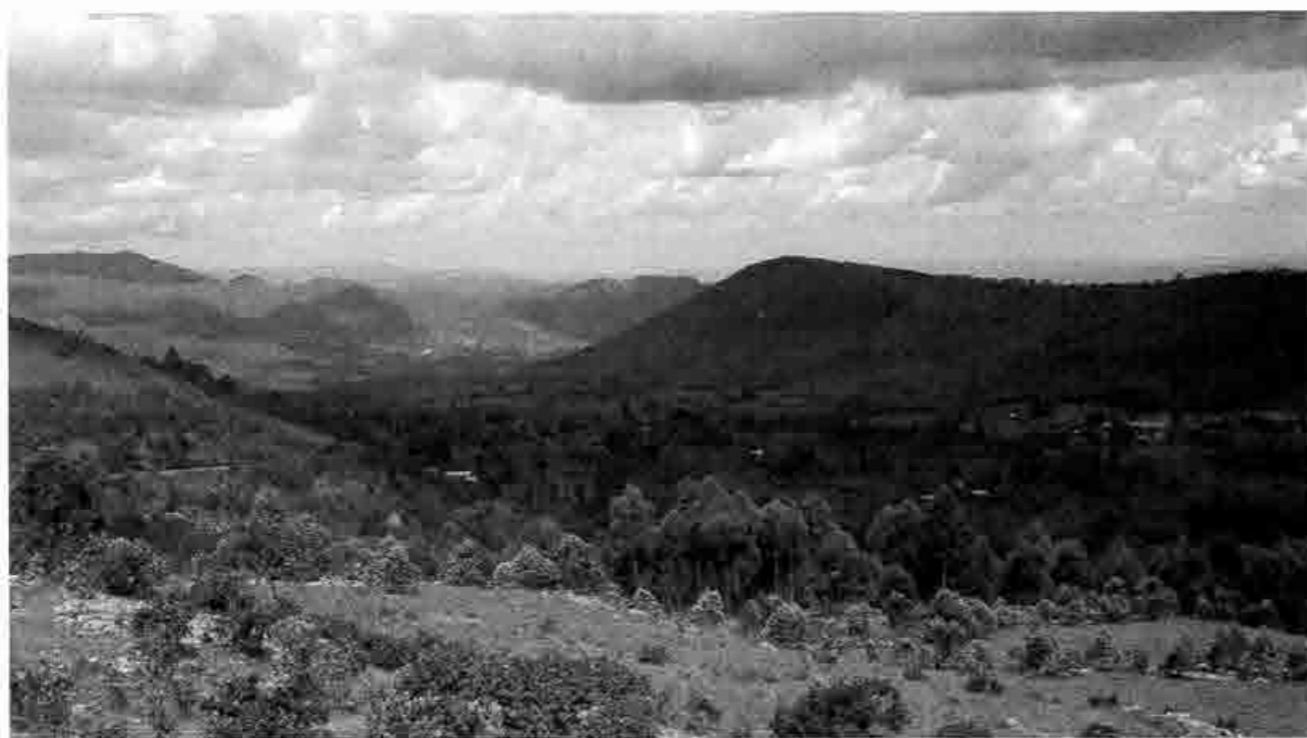
Les nuages s'amoncellent au-dessus du Burundi, avec le troisième mandat du président Pierre Nkurunziza.