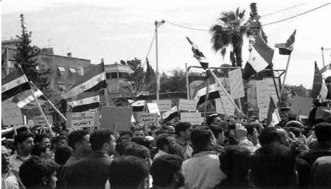
Manifestation de l'opposition au régime de Bachar El Assad à Damas