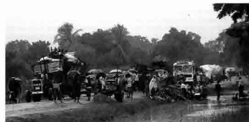
Réfugiés tamouls dans la province du Vanni déplacés suite à l'attaque de l'armée Sri-Lankaise