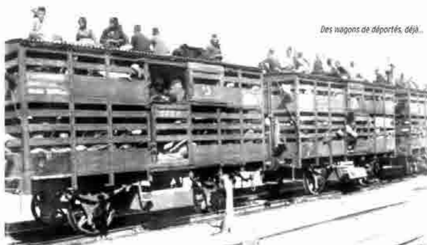
Des wagons de déportés, déjà...

Le samedi 24 avril 1915, à Constantinople, capitale de l'empire ottoman, 2345 Arméniens appartenant à l'élite intellectuelle sont arrêtés et exécutés sur ordre du gouvernement. Le ministre de l'Intérieur Talaat Pacha envoie un télégramme à la direction du parti des Jeunes Turcs à Alep : « Le gouvernement a décidé de détruire tous les Arméniens résidant en Turquie. Il faut mettre fin à leur existence, aussi criminelles que soient les mesures à prendre. Il ne faut tenir compte ni de l'âge ni du sexe. Les scrupules de conscience n'ont pas leur place ici ».