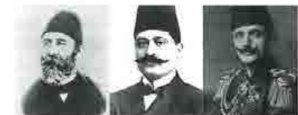
De gauche à droite : Djemal, Talaat et Enver, les artisans bouillants du génocide arménien.

Les nombreuses interventions restèrent vaines tant la haine destructrice était forte. L'ambassadeur des Etats-Unis, Henry Morgenthau, de confession juive, protesta sans suite, et se décida même à racheter la survie d'une poignée d'Arméniens auprès de Talaat. Celui-ci lui répondit : « Pourquoi voulez vous dépenser tant d'argent pour sauver des Arméniens ? De toute façon, nous devons tous les tuer pour ne pas craindre la vengeance des survivants ! ». Tous les ordonnateurs du génocide furent condamnés à mort par un tribunal ottoman en 1920. Ils s'enfuirent en Allemagne et c'est à Berlin qu'un justicier arménien, Soghomon