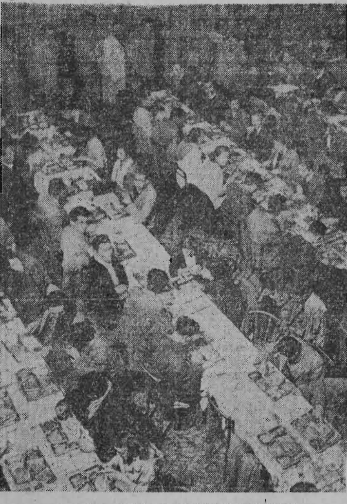
On fait la queue au restaurant universitaire

Ce que le maître dit C'est dans cette atmosphère violente de la Montagne Sainte-Geneviève que se développe l'Université de Paris. D'après la nature de ses enseignements, maîtres et étudiants étaient divisés en quatre facultés : Théologie, Droit Canon ou droit ecclésiastique (ce n'est qu'en 1879 que fut autorisée l'enseignement du droit romain), Médecine et Arts Libéraux.