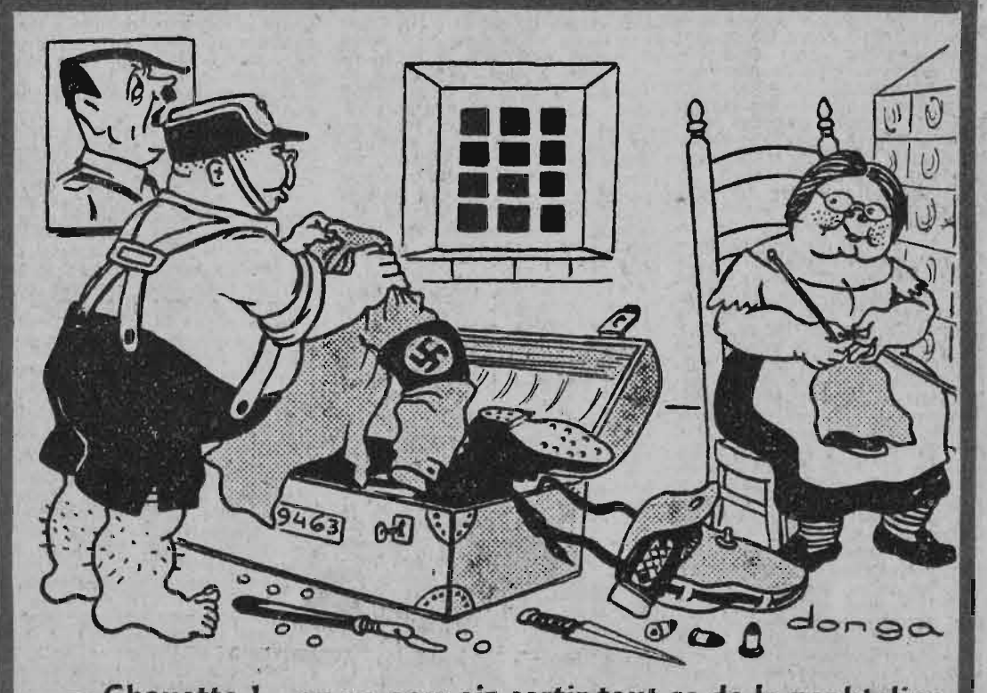
— Chouette !... on va pouvoir sortir tout ça de la naphtaline.

L'Armée Rouge recula, parcourut des milliers de kilomètres jusqu'à ce que Stalingrad, la Marne de l'Orient, marquât l'arrêt suprême et la première défaite de la Wehrmacht. Sur un chemin bordé de gibets, semé de millions de morts sans tombes, tandis que les partisans harcelaient l'ennemi, elle marcha jusqu'à Berlin. Un an après la chute de Stalingrad, elle décrivait les derniers survivants du camp d'annihilation d'Auschwitz. Pendant toute la campagne, le courage de milliers de combattants Juifs, s'inscrivait à l'honneur du jour. Le journaliste Ilya Ehrenbourg souligna à maintes reprises cette contribution glorieuse. Une telle orientation de l'histoire ne pouvait rester sans influence sur la pensée et l'attitude de toutes les communautés Juives du monde à l'égard de l'Union soviétique. Si les sympathies ou les réserves de principe envers le communisme russe demeurent, une immense gratitude remplit les cœurs Israélites pour la nation qui, comme la France jadis incarne la première la liberté, incarne l'égalité et aussi, avec quelle rigueur, la volonté de justice et de châtiment.