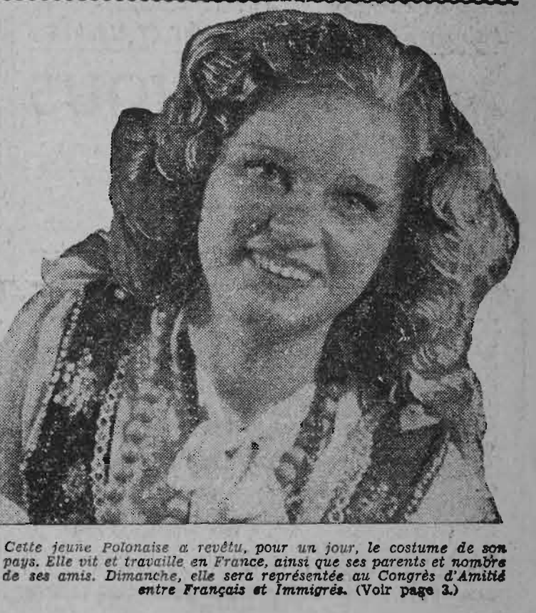
Cette jeune Polonaise a revêtu, pour un jour, le costume de son pays. Elle vit et travaille en France, ainsi que ses parents et nombre de ses amis. Dimanche, elle sera représentée au Congrès d'Amitié entre Français et Immigrés. (Voir page 3)

La réponse du Monde Le journal le Monde n'est pas, semble-t-il, suspect de « voir les tristes partout ». On peut lire, pourtant, dans son numéro du 11 novembre, sous le titre : « Qui profite des pogroms d'Irak ? » Pétrole et sang : cette association de roman-feuilleton n'a jamais été si réelle. D'Irak, Etat (Suite en page 4)